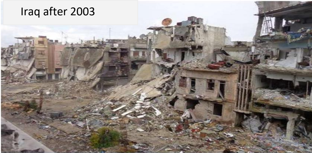
Iraq after 2003