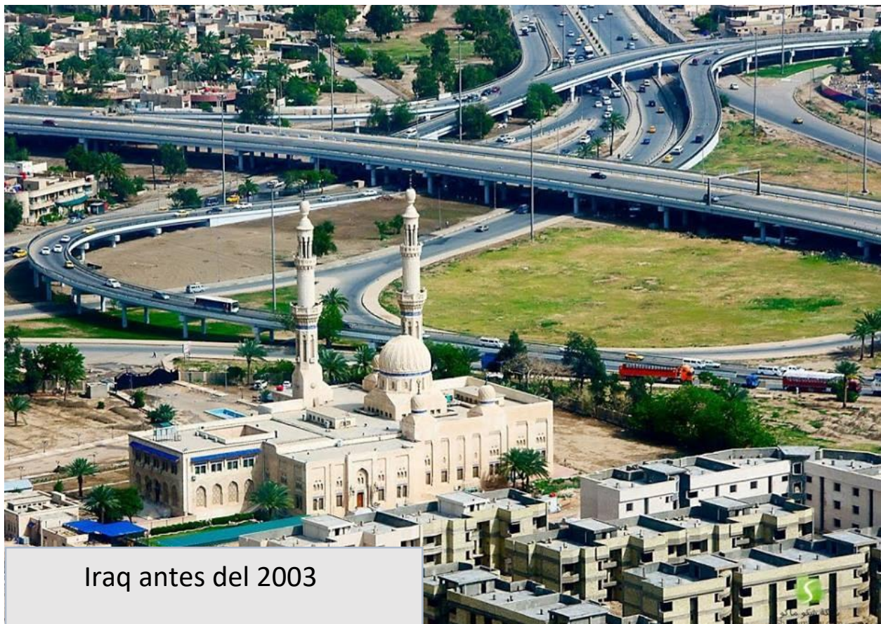
Iraq antes del 2003